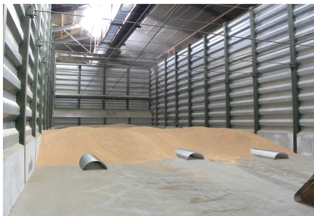
Kanalafstand ved tørring: Korn 100 cm. Frø 80 cm

GP-1600 sidekanal er beregnet for kanallængder op til 10 - 12 m i frø og 12 - 18 m i korn (tørring)